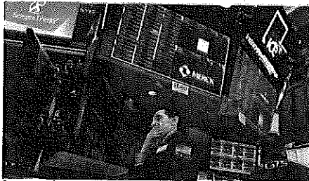
Se espera que la semana finalice de forma estrepitosa luego de las constantes caídas.

El S&P 500 se enfila a cerrar su peor semana desde octubre